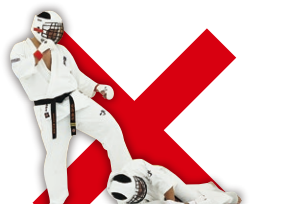
倒れた相手への攻撃 Attacking a downed opponent