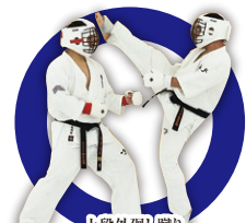
上段外廻り蹴り Upper Outside Roundhouse Kick