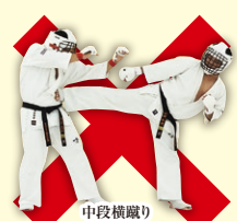
中段横蹴り Middle Side Kick