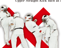
膝蹴り Knee Kick