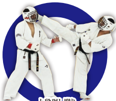
上段廻り蹴り Upper Roundhouse Kick