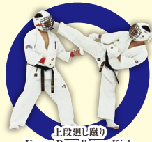
上段廻り蹴り Upper Roundhouse Kick