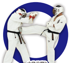
中段前蹴り Middle Front Kick