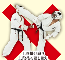
上段掛け蹴り 上段後ろ廻り蹴り Upper Spinning Back or Hook Kick