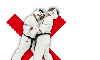
頭突き Head Butting