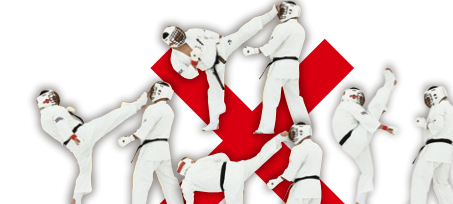
前面からの直線的な上段蹴り(上段前蹴り・上段横蹴り・上段後ろ蹴り・踵落とし等) Upper Straight Kick such as Front, Side, Back or Axe Kick