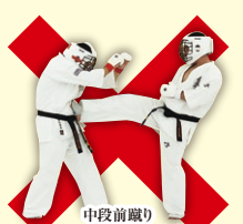
中段前蹴り Middle Front Kick