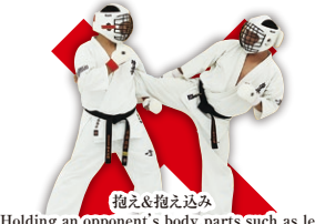
抱え/抱え込み Holding an opponent's body parts such as leg