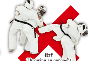
投げ Throwing an opponent

◎有効反則技について 写真で説明している「有効技」と「反則技」は、あくまでも 主な例であり、ここにある技 がすべてではありません。 These techniques and fouls are only examples. 監修/磯部清次(大会審判長) 演武/安島喬平(茨城中央支部長) 竹岡拓哉(神奈川大和支部長)