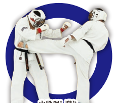
中段廻り蹴り Middle Roundhouse Kick