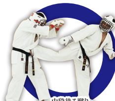
中段後ろ蹴り Middle Back Kick