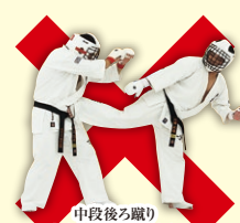
中段後ろ蹴り Middle Back Kick