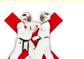
肘打ち Elbow Strike