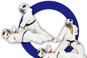
有効技で転倒した相手へ突きから残心 Downing an opponent by effective technique, Fore-Fist Thrust and Zanshin