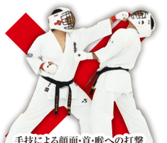
手技による顔面・首・喉への打撃 (上段突きは寸止めのみ有効) Hand Strike to the Face, Neck or Throat. (Only Non-Contact is allowed)