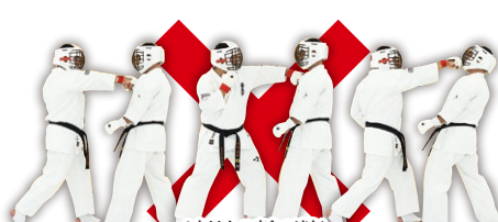
3本以上の突きの連打 Combination of Three Fore-Fist Thrust or more