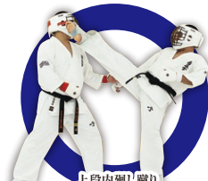
上段内廻り蹴り Upper Inside Roundhouse Kick