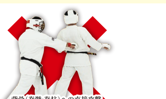
背骨(背髄・脊柱)への直接攻撃 Striking the Spine