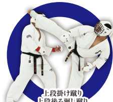
上段掛け蹴り 上段後ろ廻り蹴り Upper Spinning Back or Hook Kick