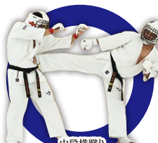
中段横蹴り Middle Side Kick