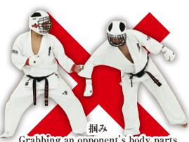
掴み Grabbing an opponent's body parts