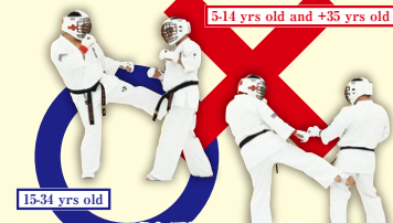
15-34 yrs old 5-14 yrs old and +35 yrs old 下段(下股)への全ての攻撃 Low Roundhouse Kick