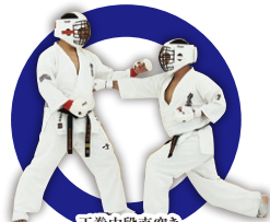
正拳中段直突き Middle Fore-Fist Thrust