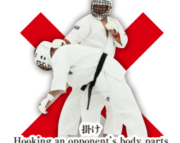
掛け Hooking an opponent's body parts