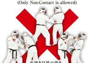
直突き以外の突き (下突き・カギ突き・振り打ち等) Any Hand Strike except Fore-Fist Thrust (Hook & Upper Cut are not allowed)