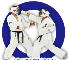
正拳上段直突き(寸止め) Upper Fore-Fist Thrust (Non-Contact)