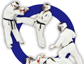
有効技での転倒から残心 by effective technique and Zanshin