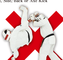
捨て身技(胴廻し回転蹴り等) Drop Kick