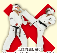
上段内廻り蹴り Upper Inside Roundhouse Kick