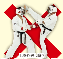
上段外廻り蹴り Upper Outside Roundhouse Kick