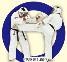
中段廻り蹴り Middle Roundhouse Kick