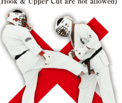
金的蹴り Groin Kick