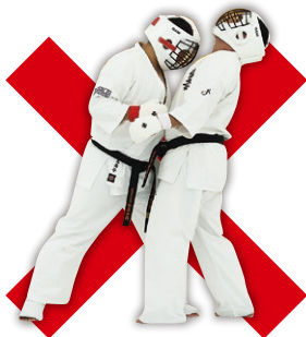
頭突き Head Butting