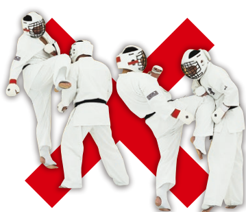
膝蹴り Knee Kick