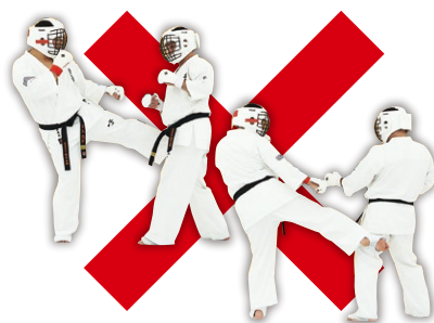
下段(下肢)への全ての攻撃 Low Roundhouse Kick