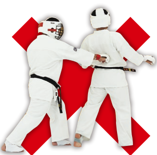
背骨(脊椎・脊柱)への直接攻撃 Striking the Spine