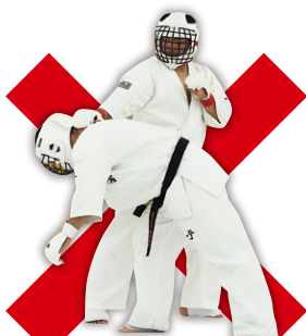
掛け Hooking an opponent's body parts