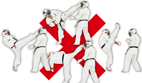
前面からの直線的な上段蹴り(上段前蹴り・上段横蹴り・上段後ろ蹴り・踵落とし等) Upper Straight Kick such as Front, Side, Back or Axe Kick