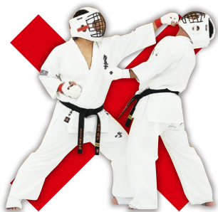
手技による顔面・首・喉への打撃 (上段突きは寸止めのみ有効) Hand Strike to the Face, Neck or Throat. (Only Non-Contact is allowed)