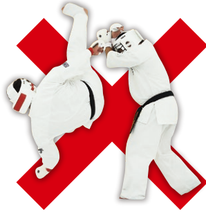
捨て身技(胴廻し回転蹴り等) Drop Kick