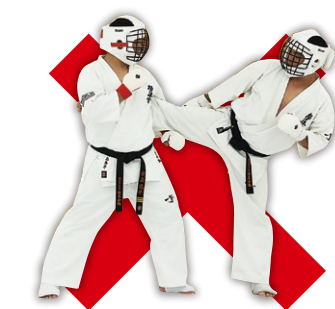
抱え&抱え込み Holding an opponent's body parts such as leg