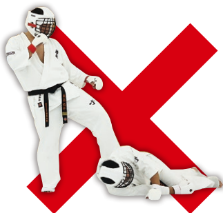
倒れた相手への攻撃 Attacking a downed opponent