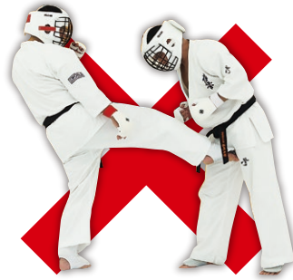
金的蹴り Groin Kick