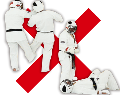
足掛け・足払い Foot Sweep