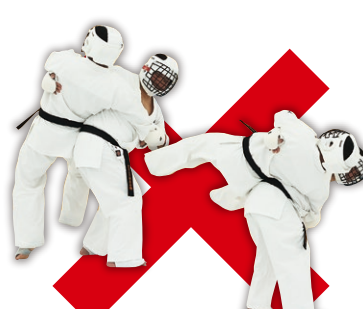
投げ Throwing an opponent

◎有効・反則技について 写真で説明している 「有効技」と「反則技」は、 あくまでも主な例であり、 ここにある技が すべてではありません。 These techniques and fouls are only examples.