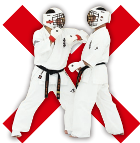
肘打ち Elbow Strike