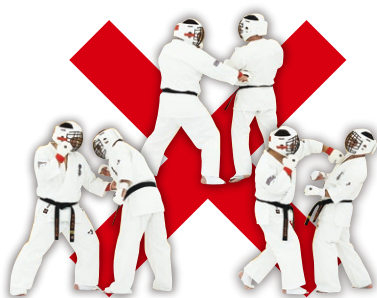
直突き以外の突き (下突き・カギ突き・振り打ち等) Any Hand Strike except Fore-Fist Thrust (Hook & Upper Cut are not allowed)