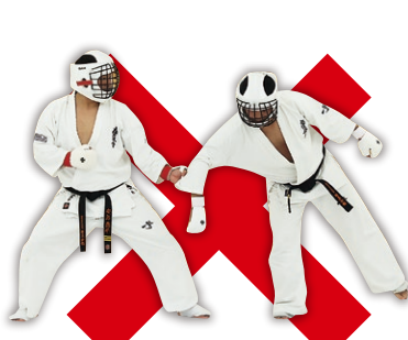
掴み Grabbing an opponent's body parts